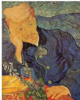
Portrait du docteur Gachet

CE SONT DES ŒUVRES QUI REPRESENTENT UNE PERSONNE. QUAND UN ARTISTE SE PEINT LUI-MÊME, ON PARLE D'AUTO PORTRAIT.