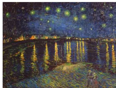
Nuit étoilée sur le Rhône