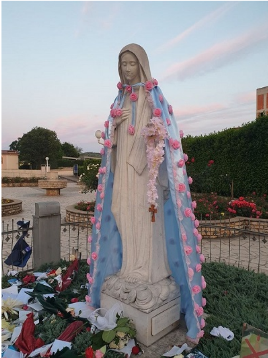
Medjugorje La Vierge du Parvis