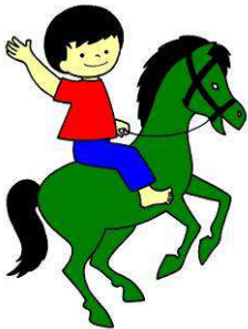
Ride a horse