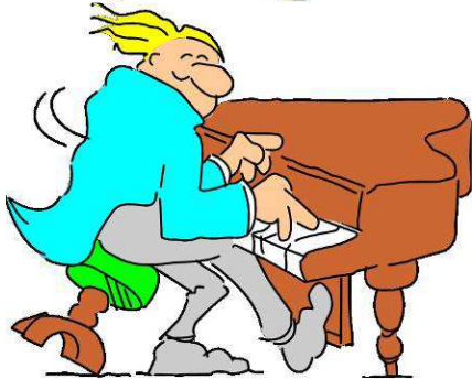
Play the piano