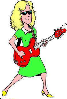
Play the guitar