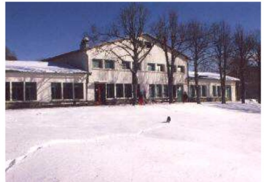
Le bâtiment Chamois