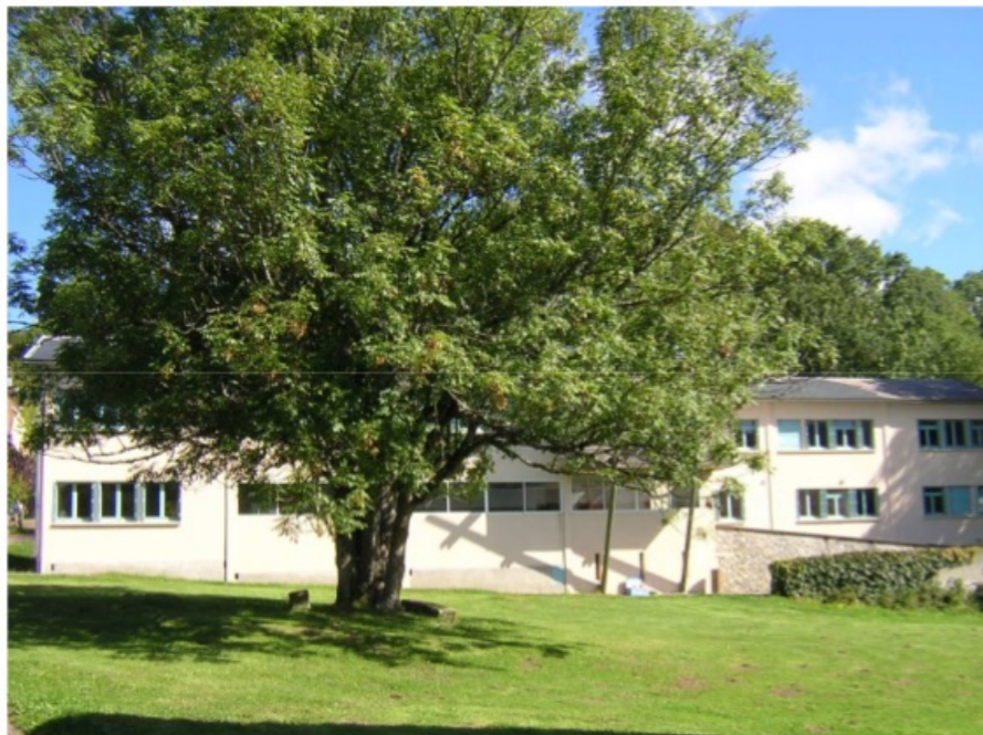
Le bâtiment Gentiane