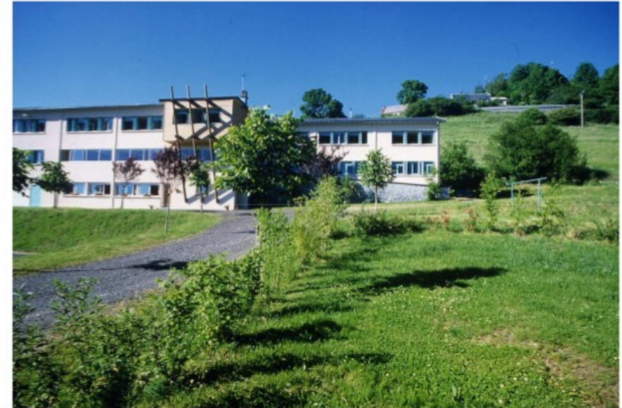
Le bâtiment marmotte