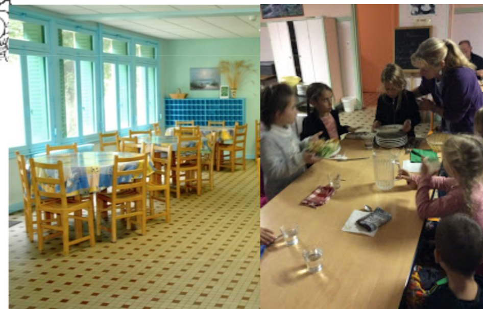
Une salle à manger