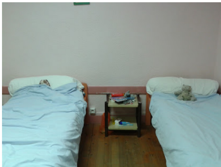
Chambre et salle de bain