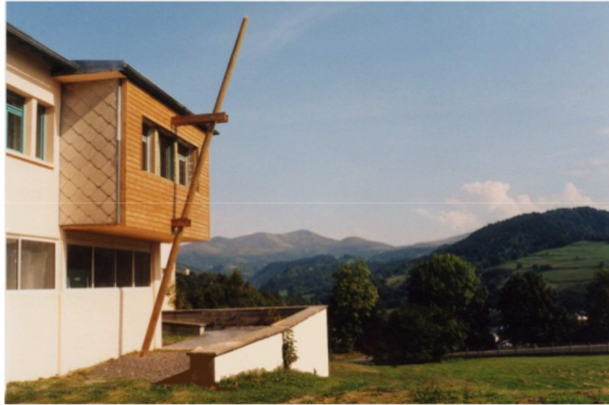
Le bâtiment Sancy