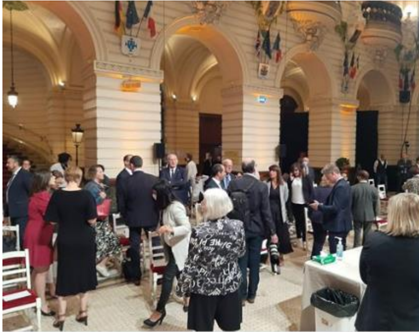
Mairie de Tourcoing le 27 mai 2020, pas de masques, pas de gestes « barrière » pour la France d'en haut du ministre qui aurait été accusé de viols et harcèlement sexuel