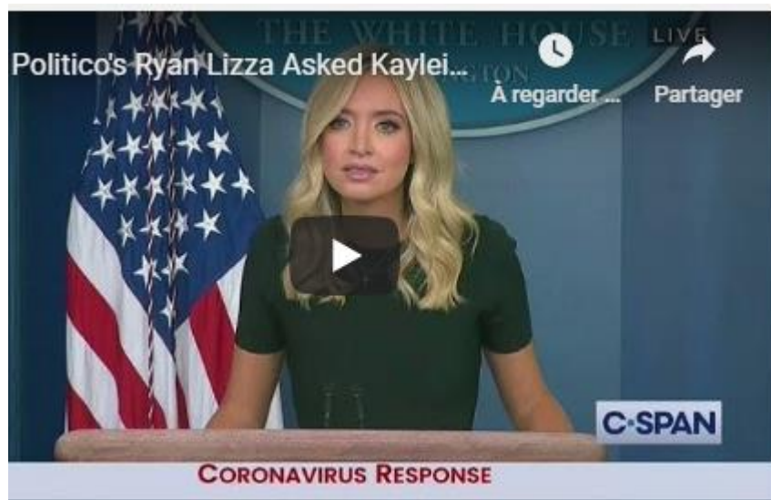
La magnifique et brillante Kayleigh McEnany

Pour en savoir plus sur Deborah Birx, cliquez sur « Une Obama Girl à la Maison Blanche »