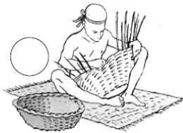
Fabrication d'objets tressés

Les hommes inventent la poterie, la vannerie et le tissage.