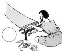
Fabrication de tissus