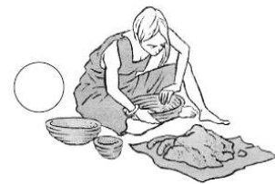
Fabrication d'objets en terre cuite

Au néolithique, les hommes dressent d'énormes pierres. Les