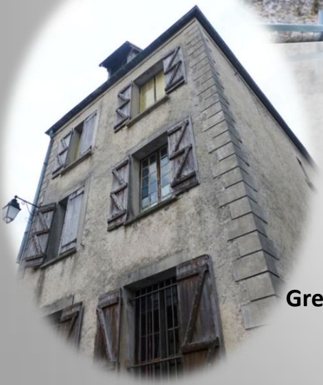
Grenier à sel