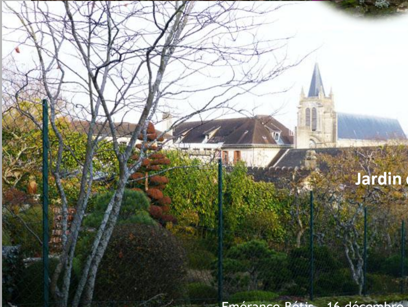
Jardin et maison de Maurice Ravel