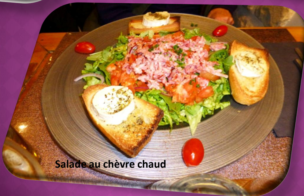
Salade au chèvre chaud