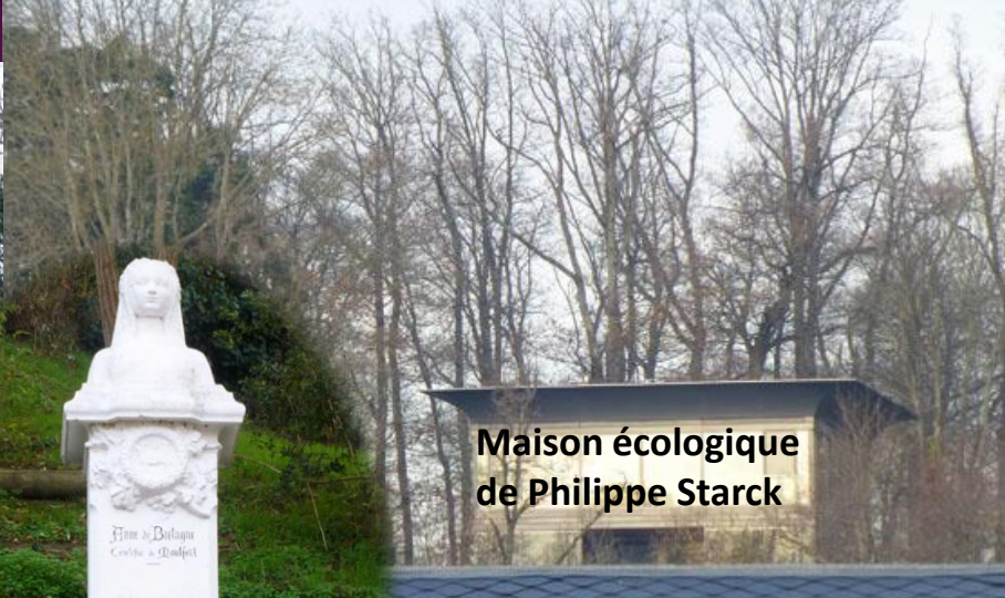
Maison écologique de Philippe Starck