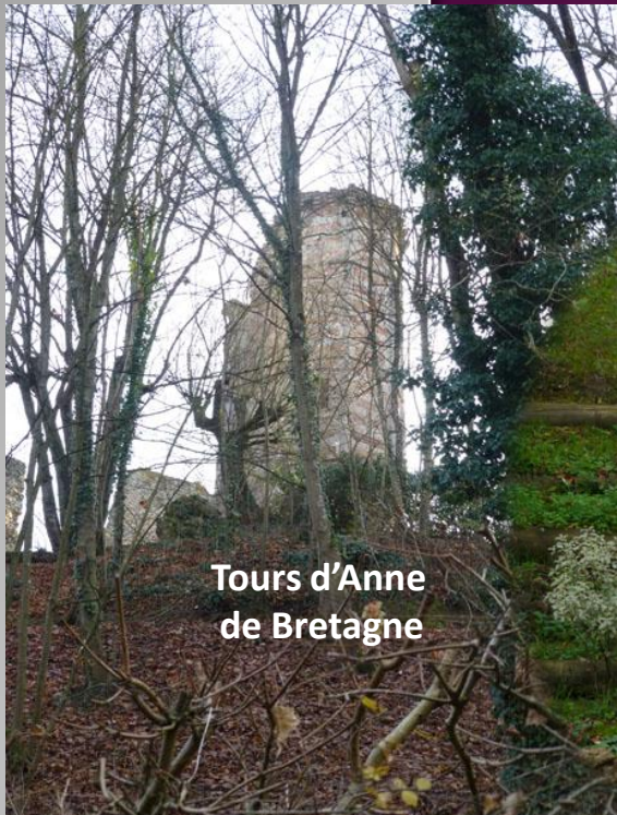
Tours d'Anne de Bretagne