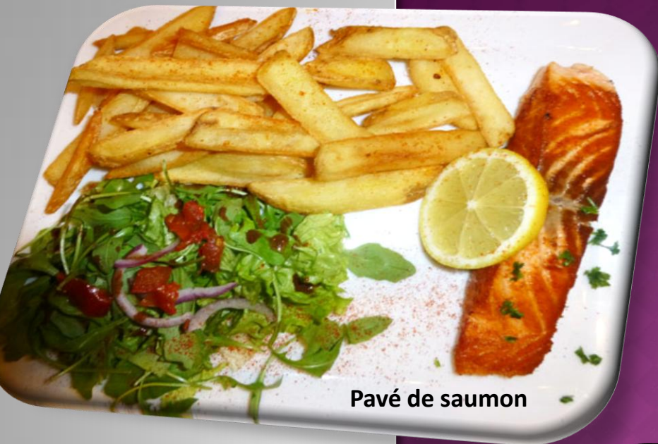
Pavé de saumon