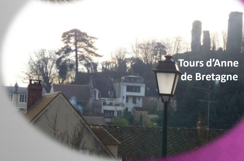
Tours d'Anne de Bretagne