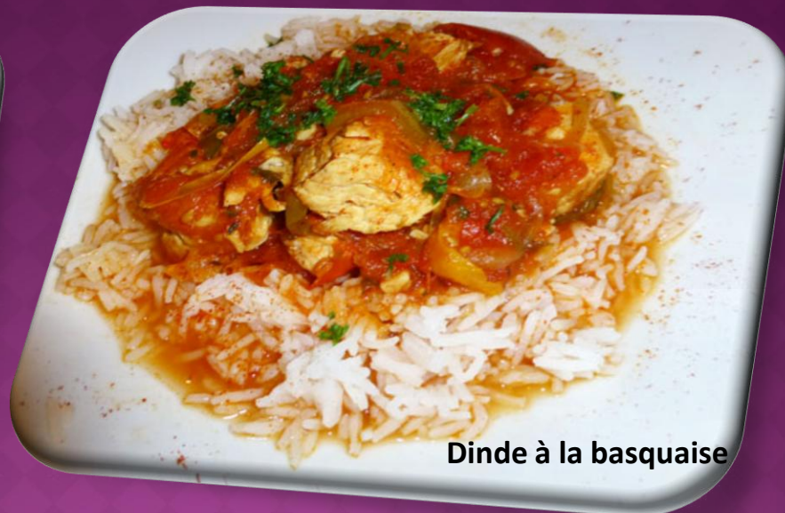
Dinde à la basquaise