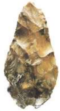
Biface en silex

Les hommes de Cro-Magnon savaient tailler des objets dans la pierre, le bois ou l'os : des armes, des outils et des bijoux. Ils savaient même coudre !