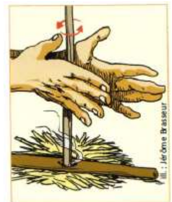
Faire du feu

Pour se nourrir, ils devaient chasser, pêcher ou cueillir des végétaux. Ils pouvaient faire cuire la viande car ils savaient faire du feu. Lorsque le gibier manquait, ils déménageaient !