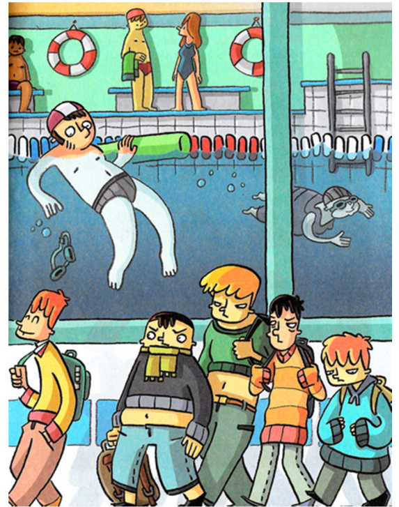
TP semaine du 28 novembre au 2 décembre 2016 www.cm-ecolesaintjeandetouslas.fr

4-Louis a mélangé les sweat-shirts de ses quatre copains et a coupé l'électricité. Résultat : ses copains ont dû s'habiller dans le noir et ont mélangé leurs vêtements ... Ils sont sortis des vestiaires bizarrement accoutrés !