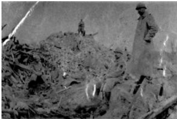
Verdun le champ de bataille

Il y a eu beaucoup de morts, près d'un million et demi de français, plus d'un million sont revenus gravement blessés (avec une jambe en moins, par exemple). Cette guerre a fait plus de huit millions de morts dans le monde.