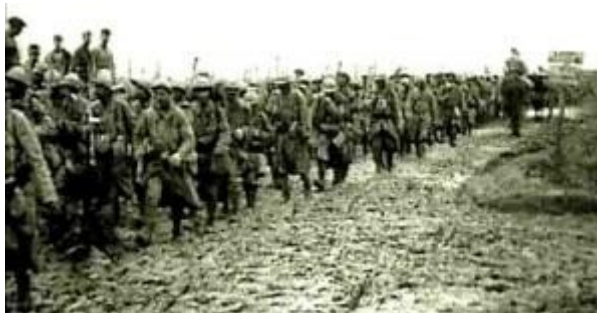
Le retour du champ de bataille

Les soldats se protégeaient dans les tranchées. Les tranchées, ce sont des trous longs et étroits creusés dans le sol. L'ennemi pouvait aussi se défendre avec du gaz toxique. Pour ne pas mourir les soldats se mettaient des masques spéciaux, les masques à gaz. Les soldats risquaient de mourir à tout instant.