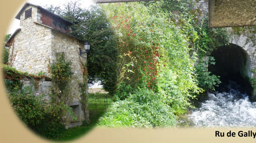
Ru de Gally