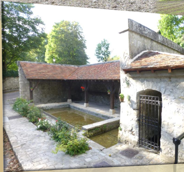
Lavoir de Rennemoulin