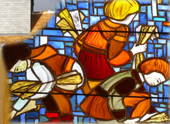
Chapelle Saint-Nicolas de Rennemoulin fraichement rénovée