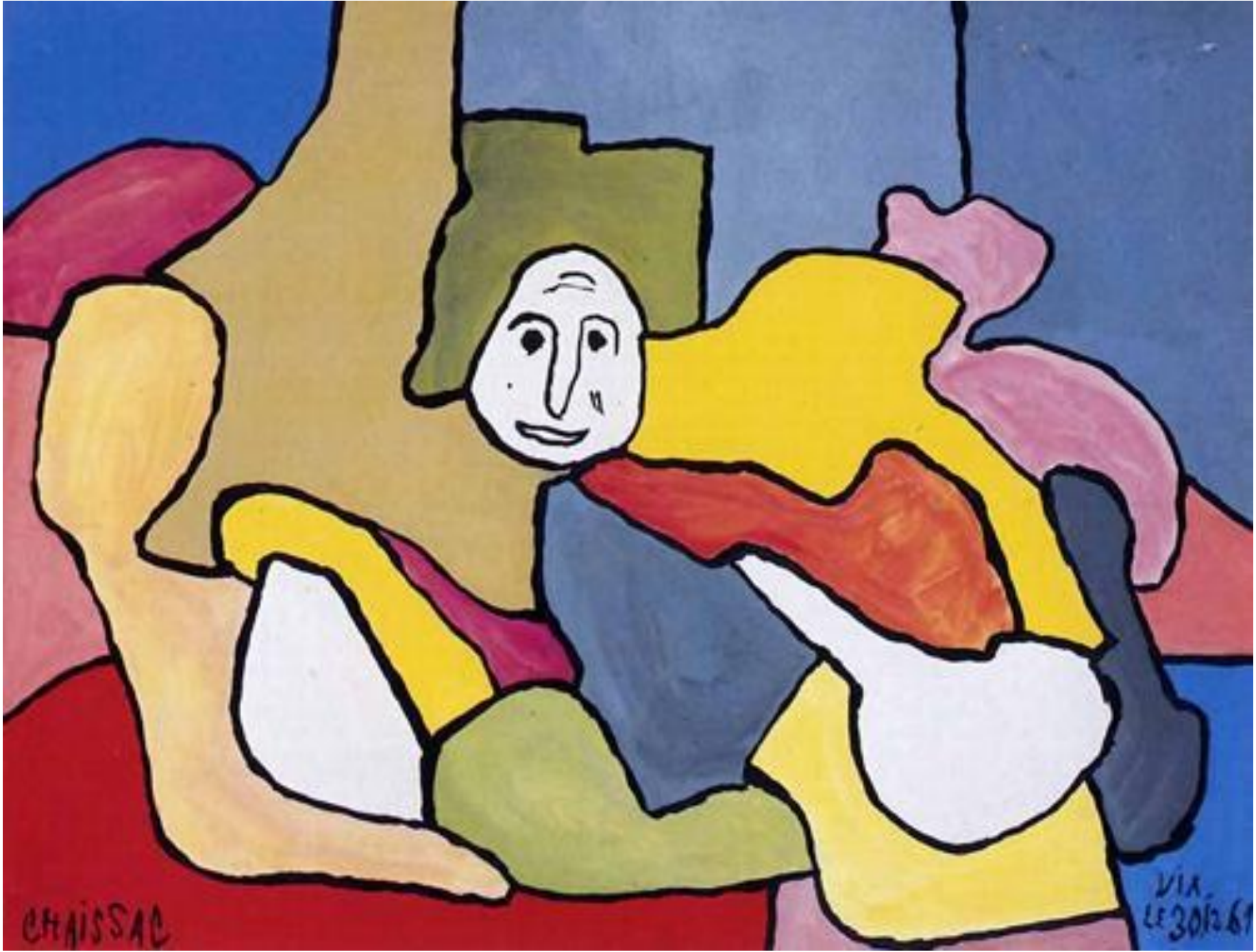
Sans titre, 1961, gouache sur papier