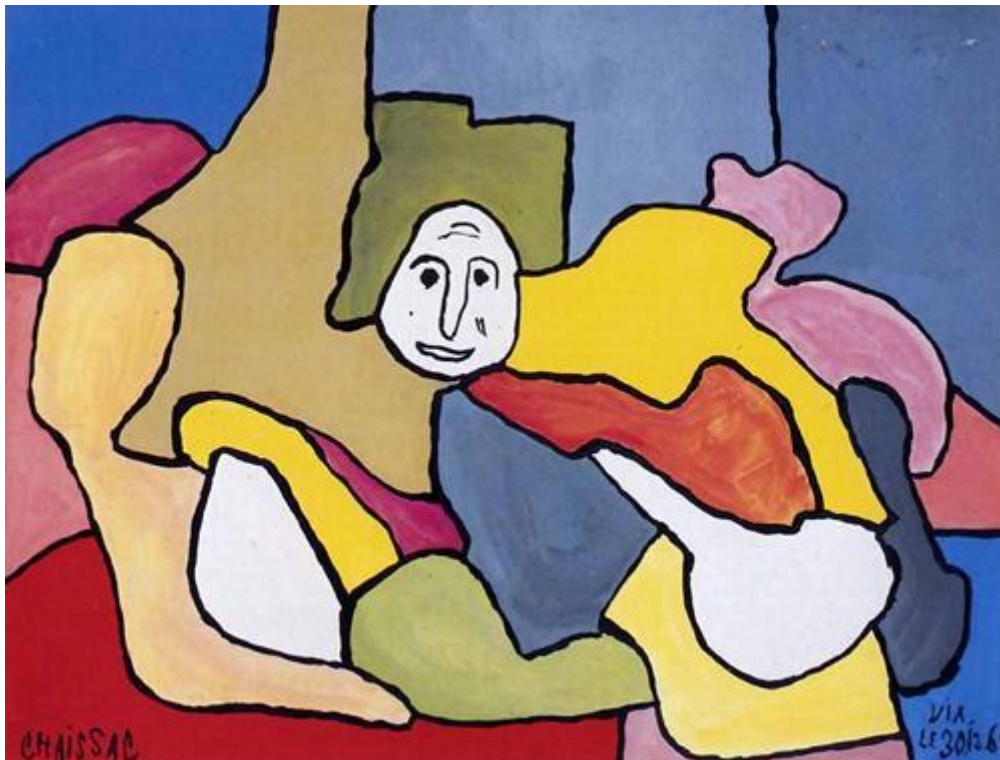
Sans titre 1961