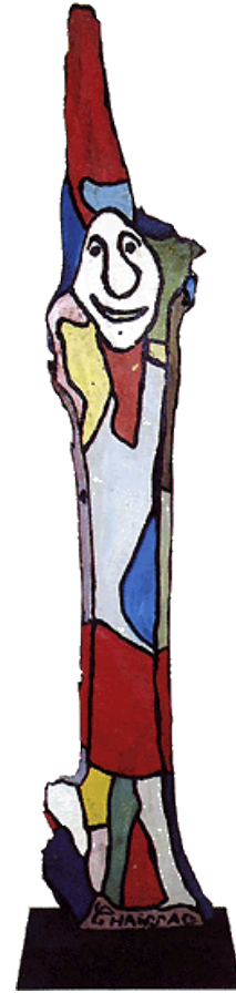
Y a d'la joie 1960