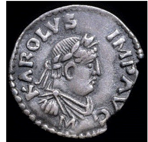
Denier en argent représentant Charlemagne, vers 812.