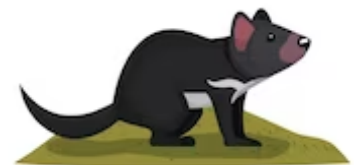
D IABLE DE TASMANIE