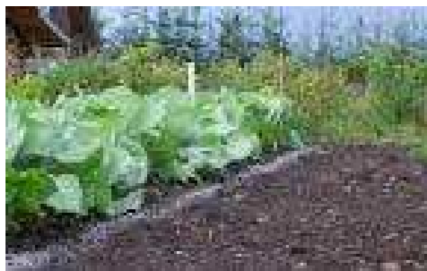
JARDINAGE : QUE PLANTER EN AUTOMNE ?