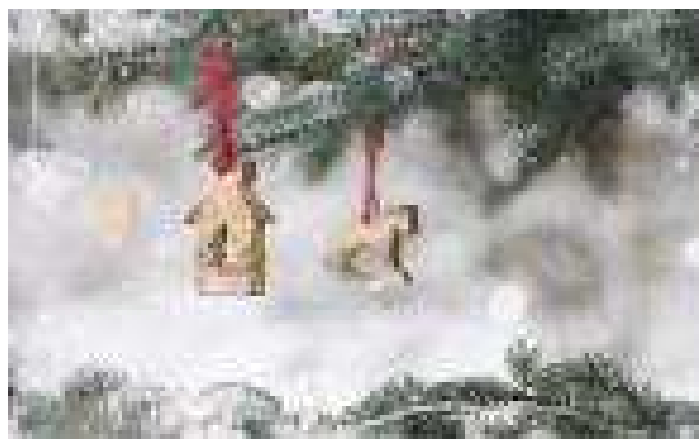
TOP 10 DES DÉCOS DE NOËL POUR L'EXTÉRIEUR