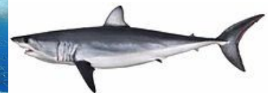
le requin mako