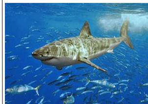
le requin blanc