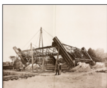
18 juillet 1887