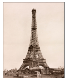
15 mars 1889