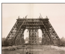
26 mars 1888