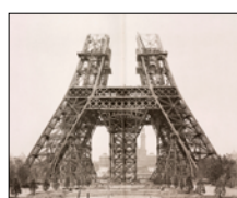
15 mai 1888