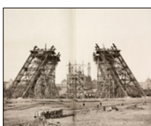
7 décembre 1887