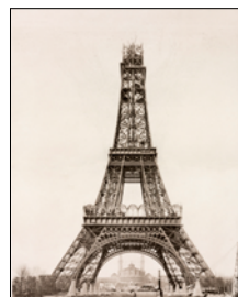
26 décembre 1888