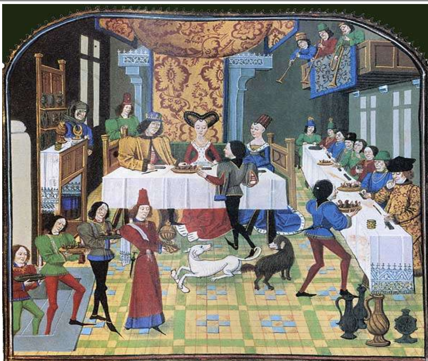
Un repas de noce au château.