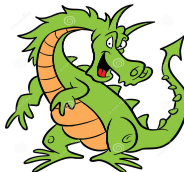
2 images pour une histoire.