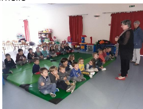
L'intervention du CCFD sur l'eau et le repas de solidarité