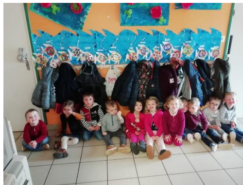
Notre fresque de porte-manteaux