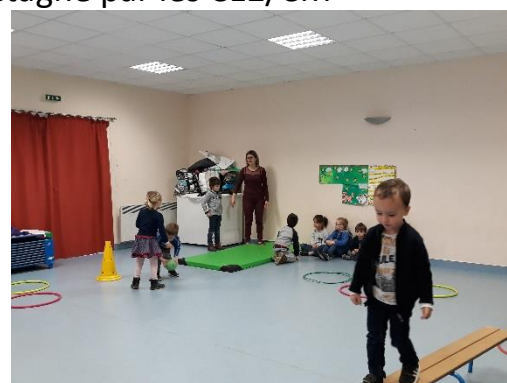
La rencontre sportive maternelle