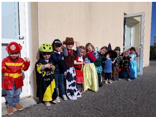
Les déguisements de Carnaval