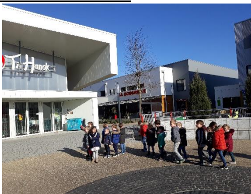
La sortie Cinécole « Rita et le crocodile »