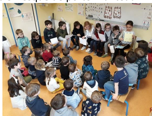
Lecture de contes et légendes de Bretagne par les CE2/CM