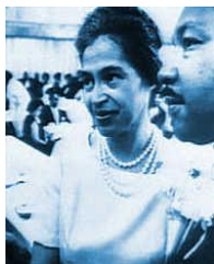
Rosa Parks et Martin Luther King

Peu après, elle est jugée dans le comté de Montgomery, Alabama : elle est condamnée à payer une amende de 10 dollars, plus 4 dollars de frais de justice. Le 5 décembre, elle fait appel de ce jugement. Martin Luther King, un jeune pasteur baptiste de 26 ans, encore inconnu du grand public, et Ralph Abernathy, un autre pasteur de Montgomery également défenseur des droits civiques, la soutiennent dans sa démarche. Ils lancent une campagne de protestation et un boycott des autobus locaux.