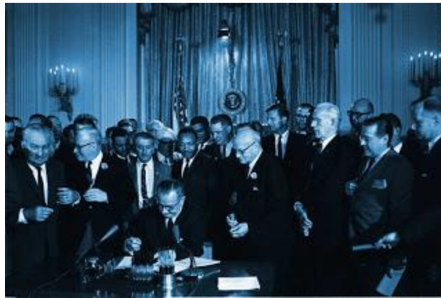
Le président Lyndon Johnson signe le « Civil Rights Act »

Ces événements ont été à l'origine de la création du mouvement pour les droits civiques qui luttera pour une société égalitaire. C'est pourquoi Rosa Parks porte le qualificatif de « mère du mouvement des droits civiques ». Huit ans plus tard, soit en 1964, le président Lyndon Johnson signe le « Civil Rights Act » déclarant illégal la discrimination reposant sur la race, la couleur, le sexe ou l'origine nationale.