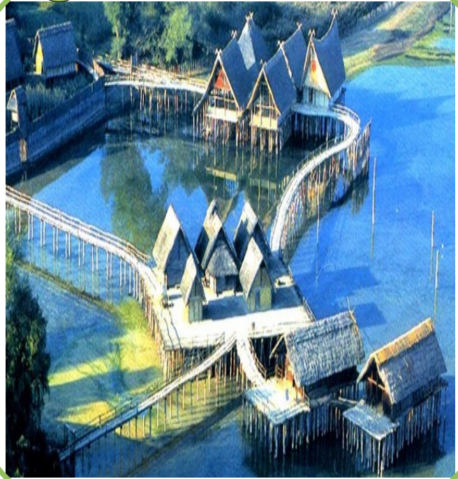
4 000 avant J.C