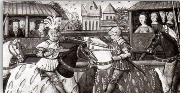
Document 1: les tournois. Le tournoi est une fête et un entraînement au combat. Les chevaliers désarment leur adversaire à coups de lance.

Pour se distraire, il organise des tournois et de grands repas où les ménestrels et les troubadours chantent et racontent des histoire. Il fait aussi la guerre aux autres seigneurs pour les piller et s'enrichir.