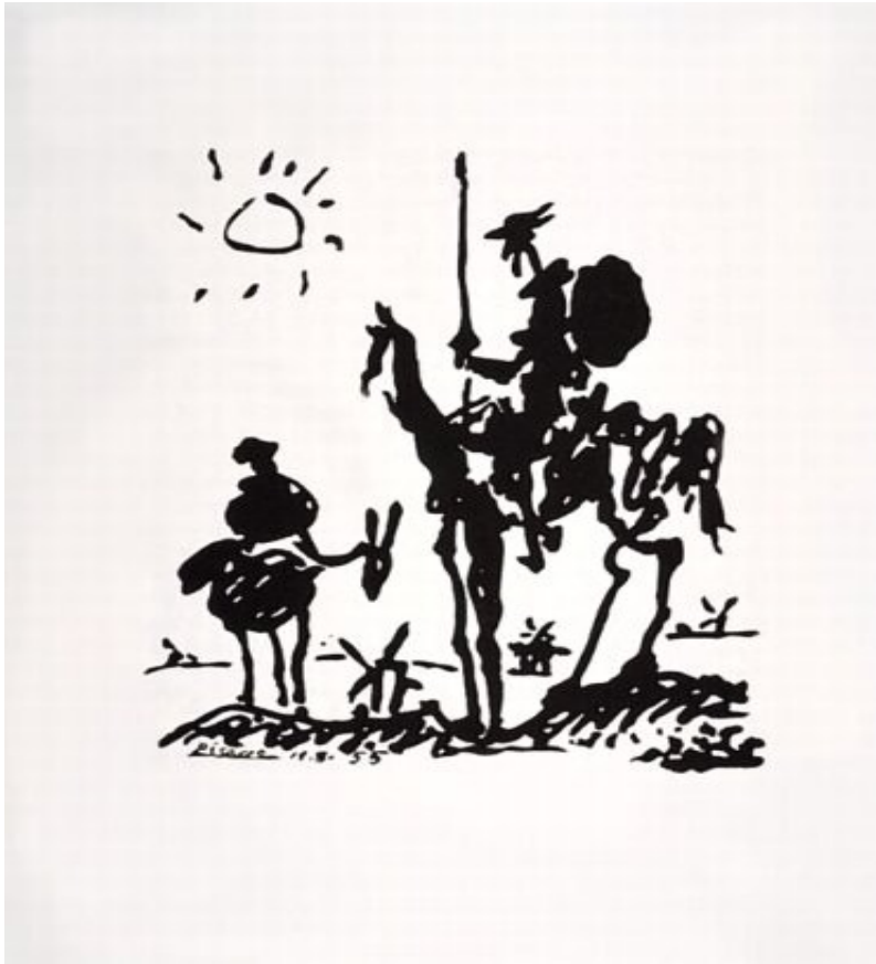
Don Quijote por Pablo Picasso

Ingenuo, mecido por las ilusiones que leyó en las novelas de caballería, vive recluido en sus sueños. Siendo acompañado por Sancho Pança, su fiel escudero, lucha contra rebaños de carneros que toma por un ejército enemigo, se pelea contra unos molinos tomándolos por gigantes.