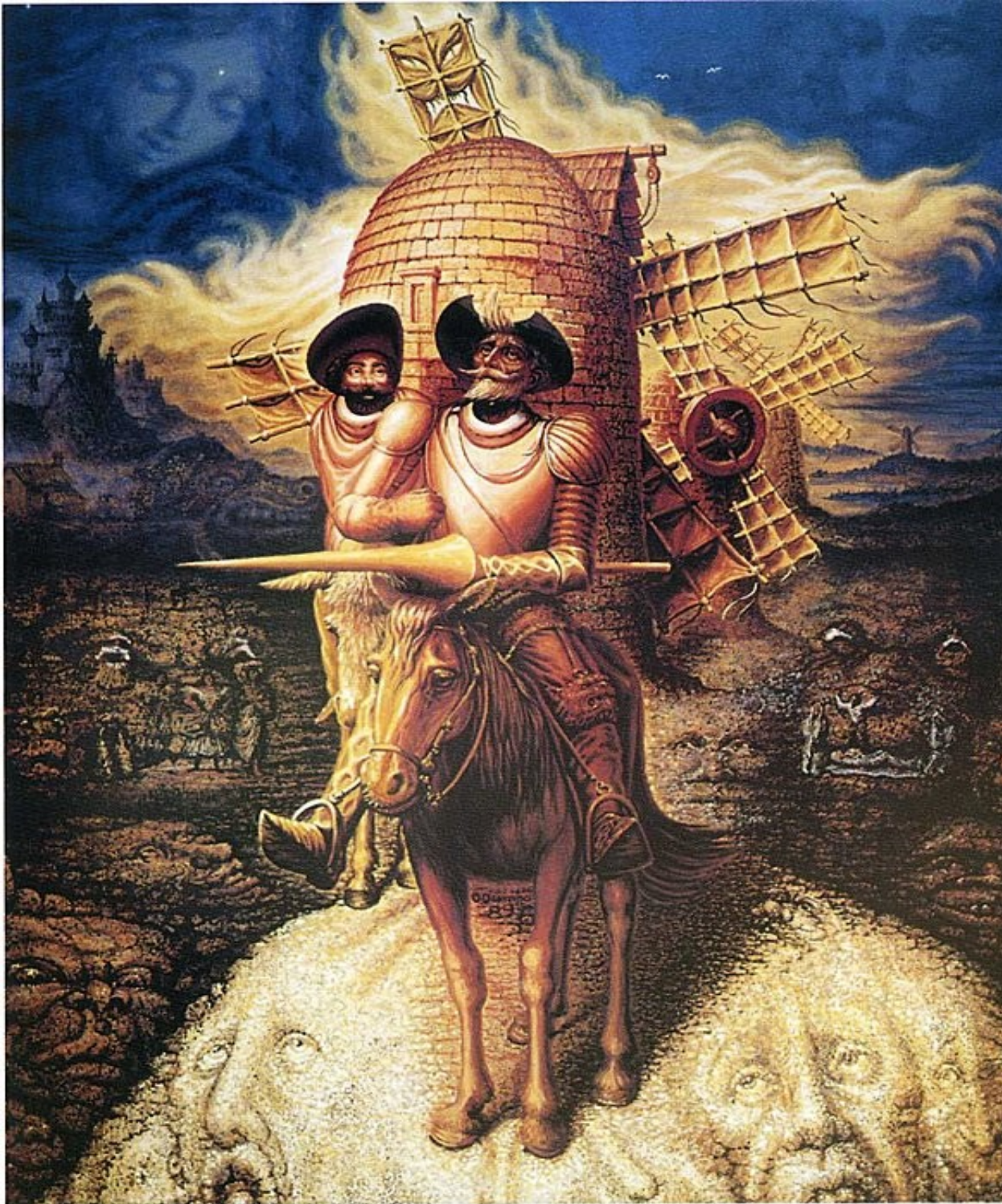
"VISIONS OF QUIXOTE," OIL ON CANVAS, 1989