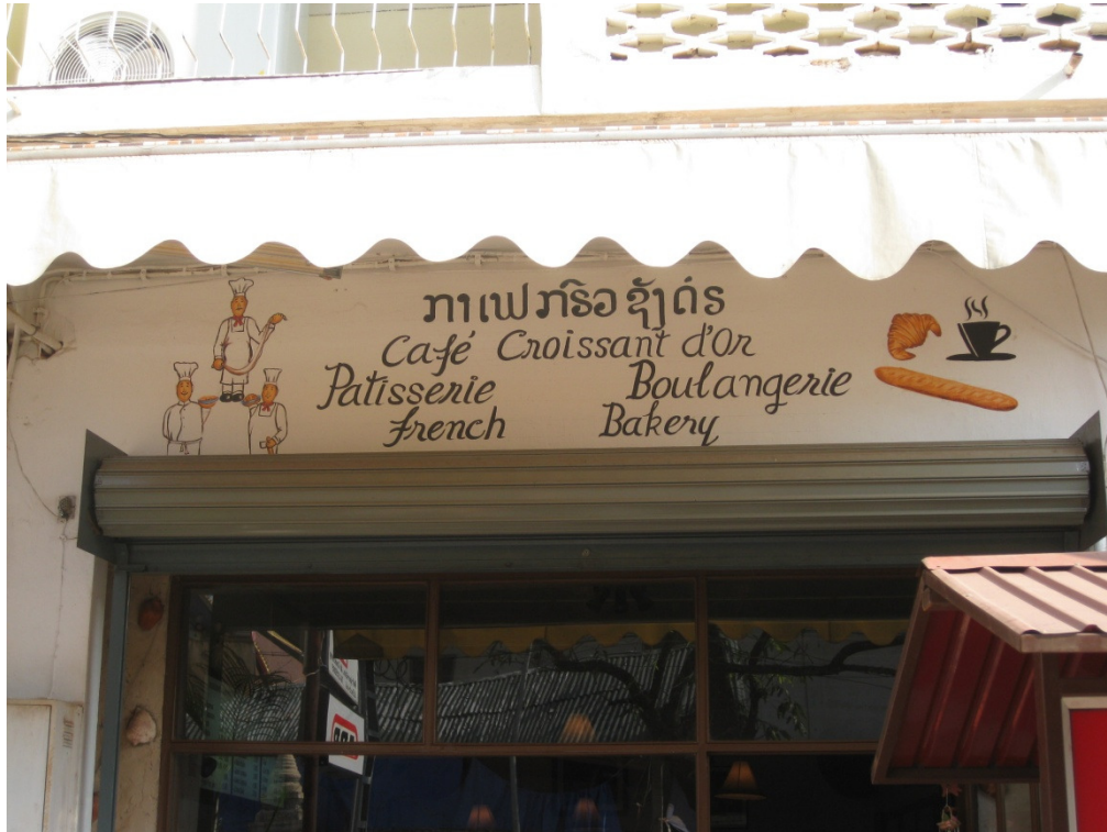
Une boulangerie au Laos