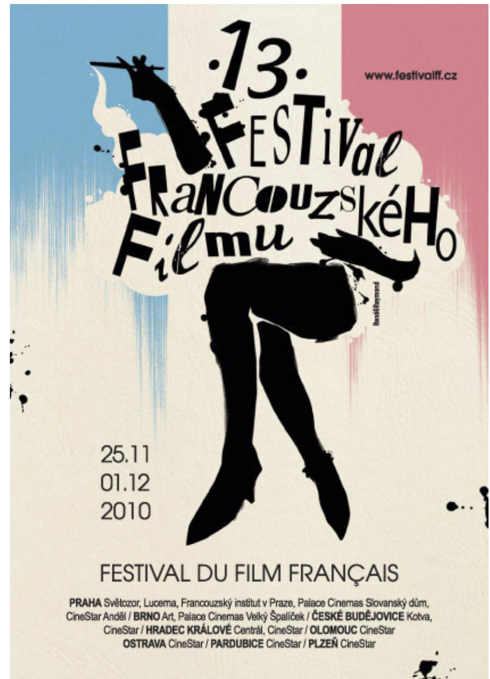
Festival du film français en République tchèque