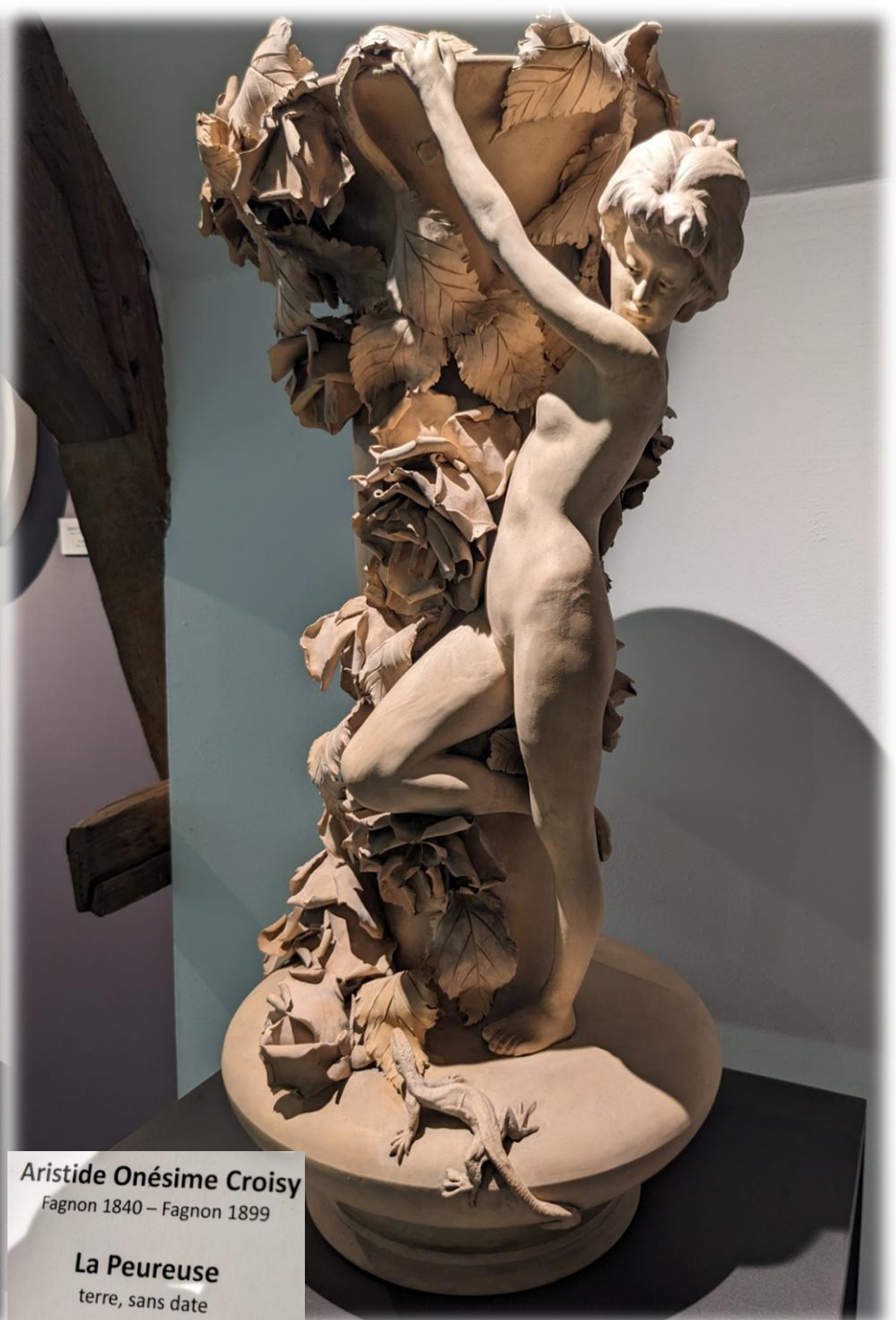
Aristide Onésime Croisy Fagnon 1840 – Fagnon 1899