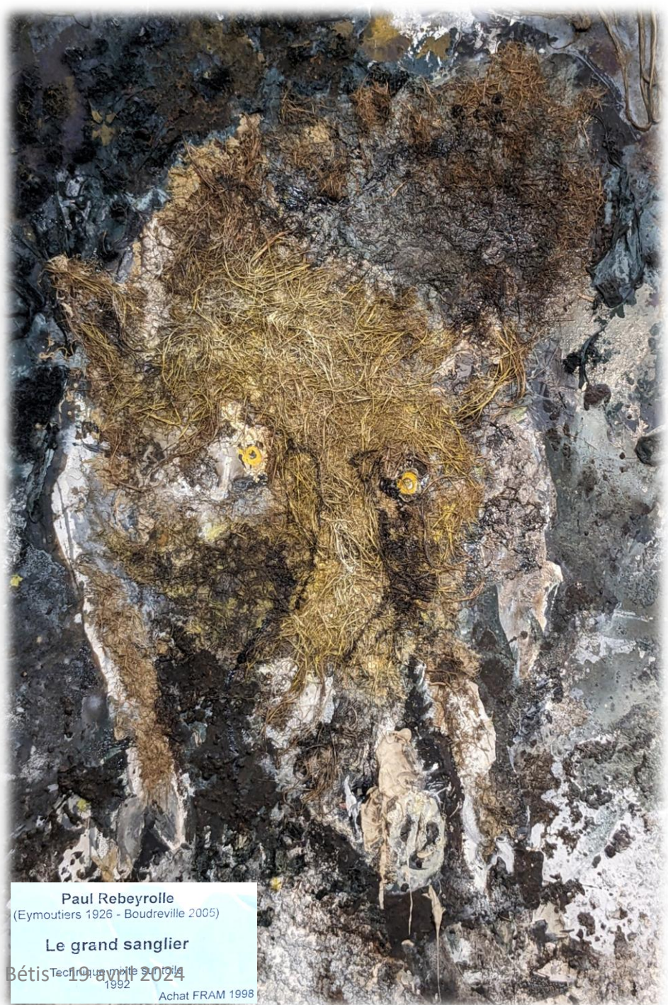
Paul Rebeyrolle (Eymoutiers 1926 - Boudreville 2005) Le grand sanglier Technique huile sur toile 1992 Achat FRAM 1998