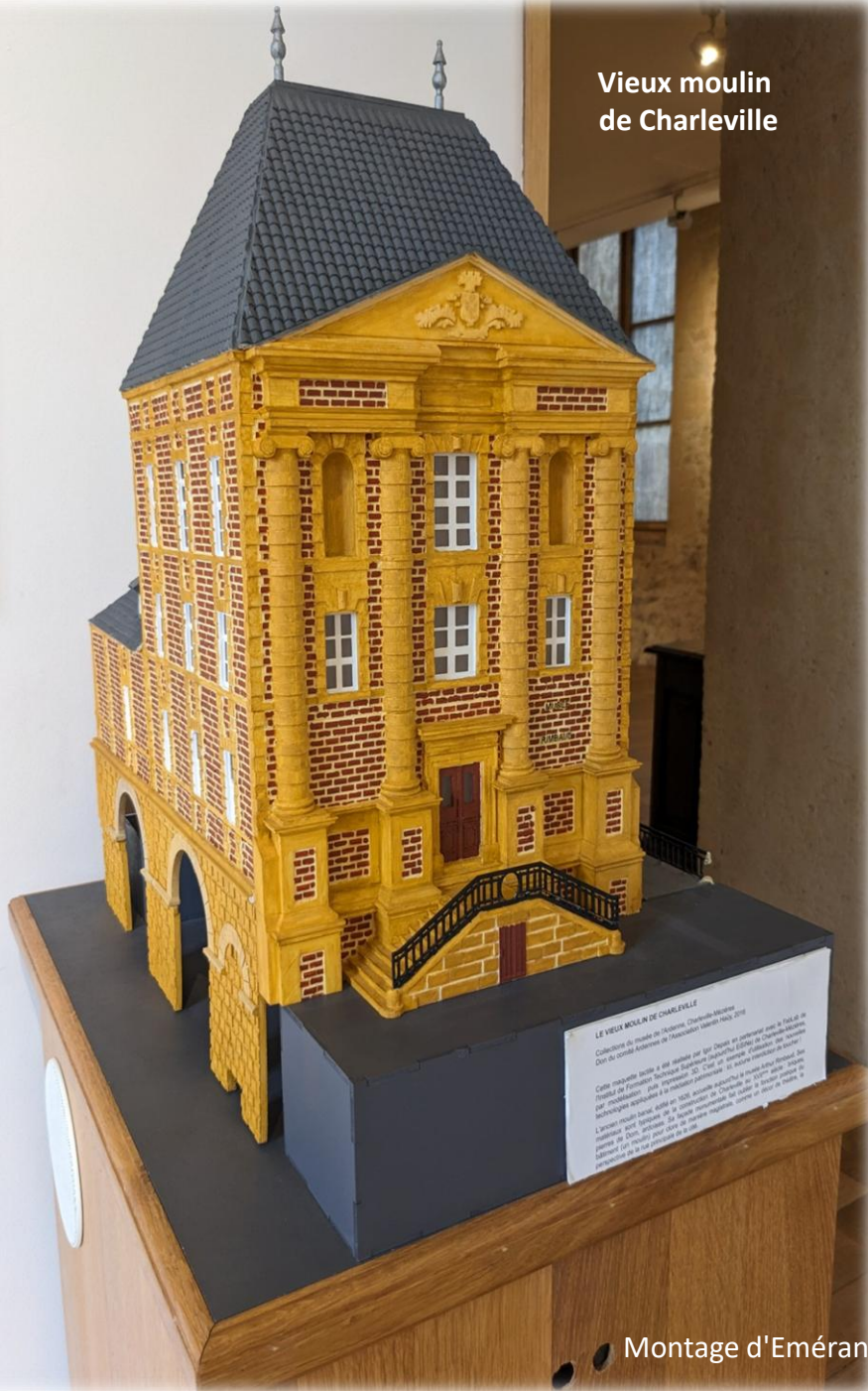
Vieux moulin de Charleville