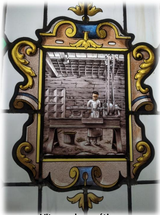
Vitraux des métiers