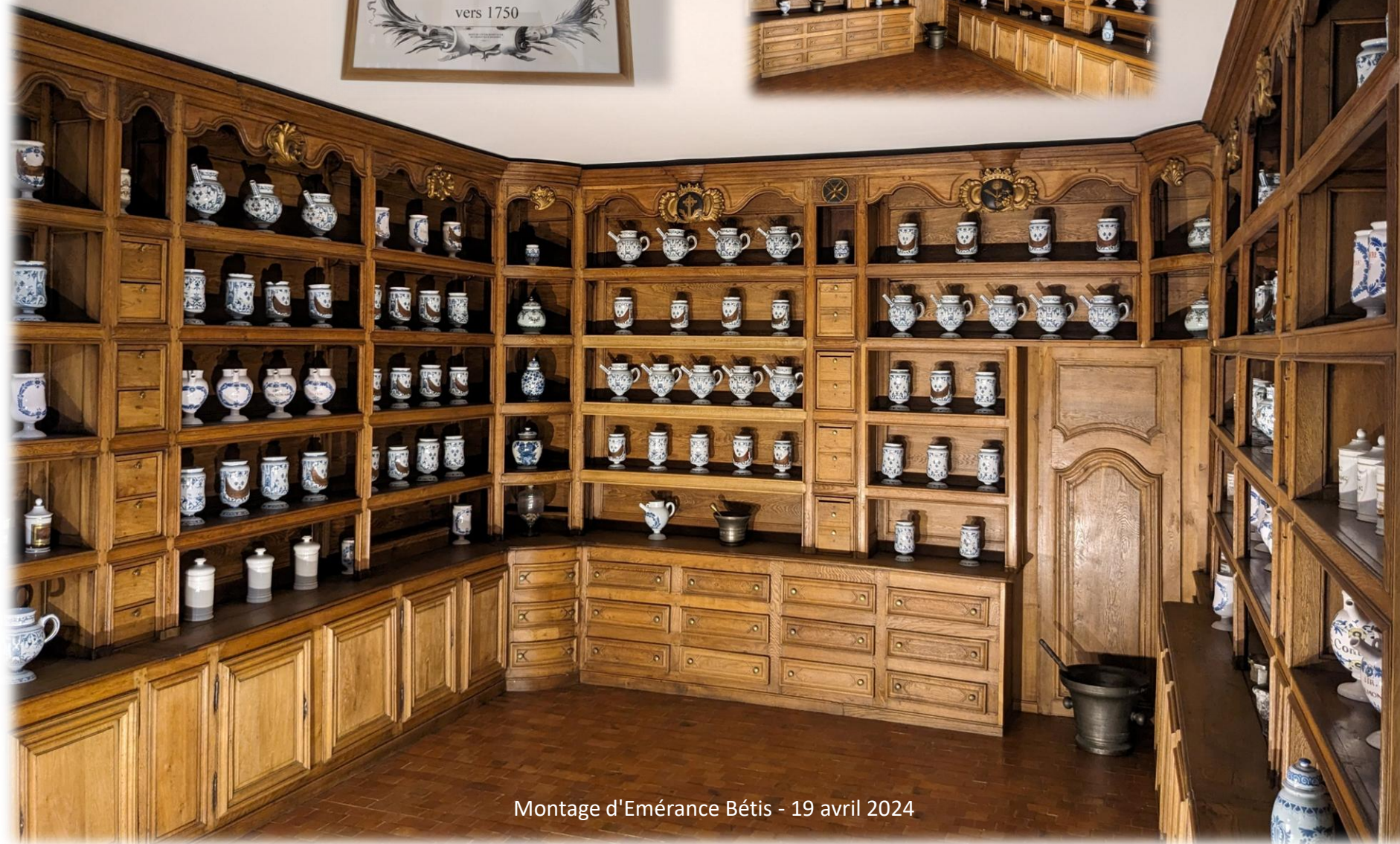
Montage d'Emérance Bétis - 19 avril 2024