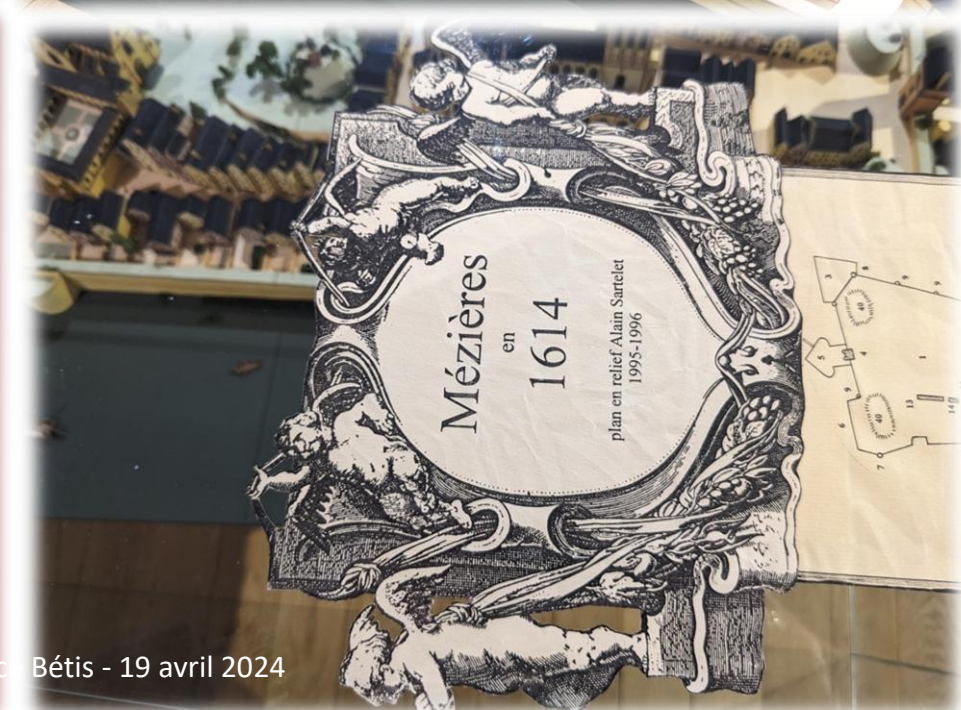
Montage d'Eméranc Bétis - 19 avril 2024