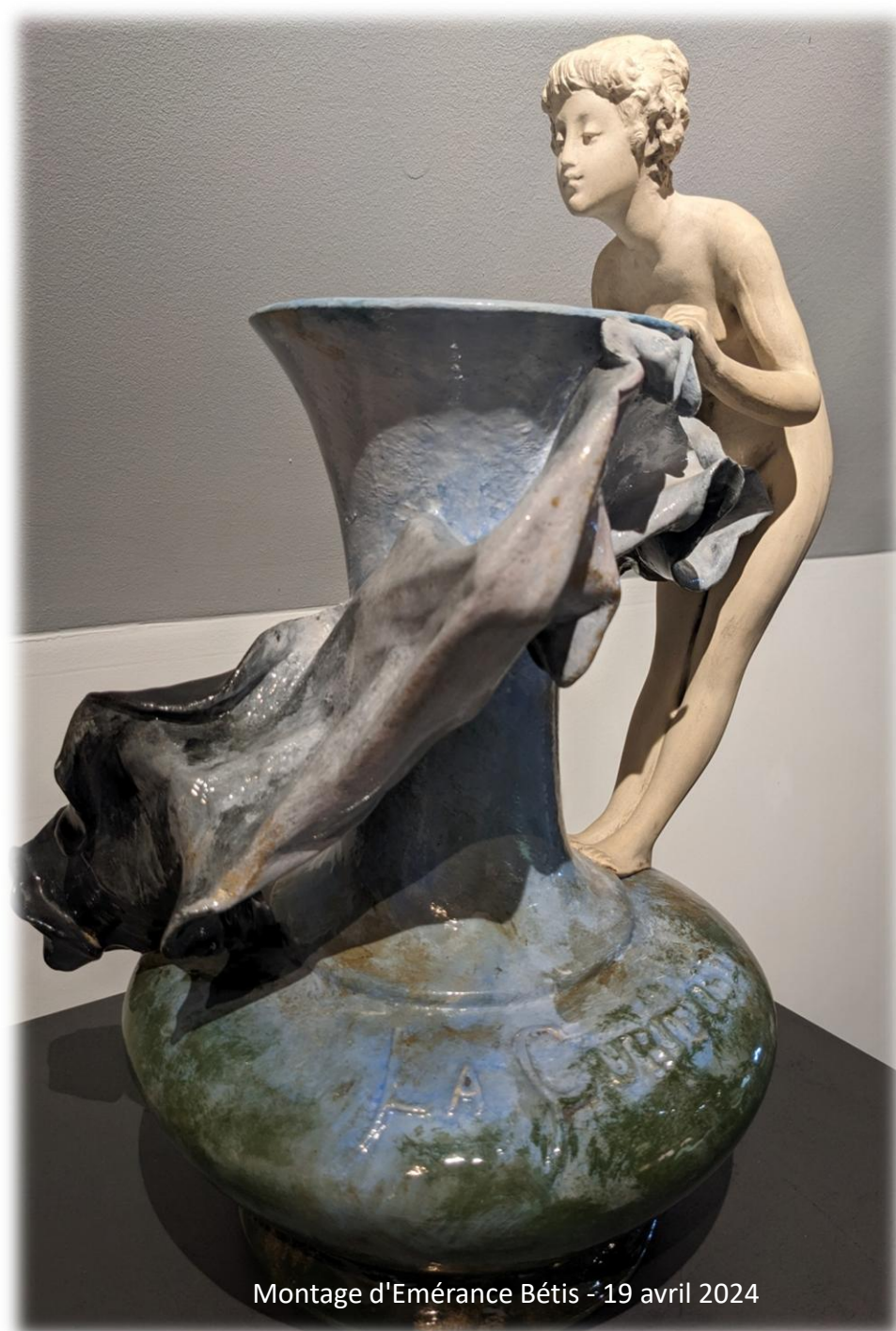
Montage d'Émerance Bétis - 19 avril 2024