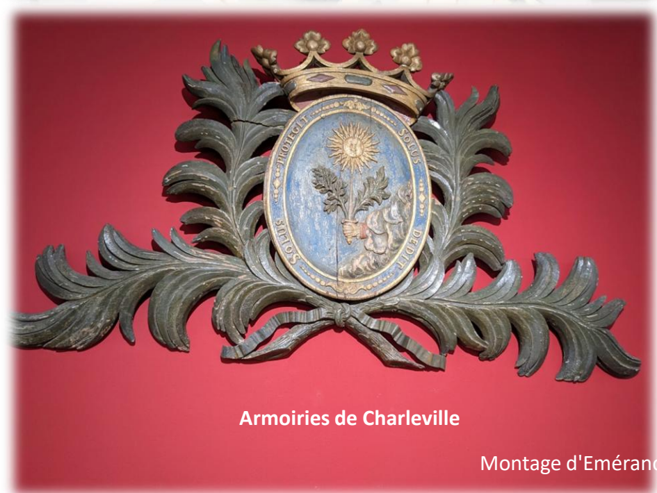
Armoiries de Charleville