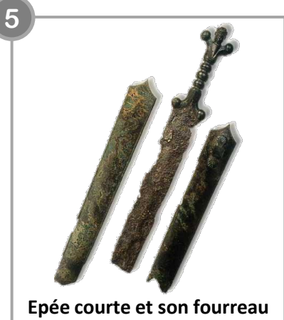
Epée courte et son fourreau