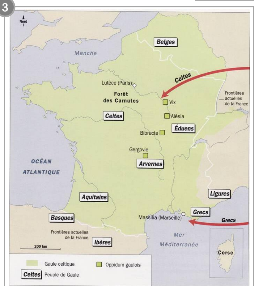
La Gaule celtique, VII ème -I er siècle av. J.-C.

2 La fondation de Massalia Récit d'un évènement survenu au VII ème siècle av. J.-C. De jeunes Grecs arrivèrent dans un golfe au sud de la Gaule. Séduits par la beauté du lieu, ils allèrent trouver le roi de la région pour lui demander l'autorisation de fonder une ville sur son territoire. Ce jour-là, le roi était occupé à préparer le mariage de sa fille Gyptis. Conformément à la coutume, celle-ci devait choisir son mari pendant le repas de noce. Le roi convia les Grecs au mariage. Pendant le repas, le roi dit à sa fille d'offrir de l'eau à celui qu'elle choisissait comme mari. Elle se tourna vers les Grecs et présenta l'eau à Protis. Celui-ci devint donc le gendre du roi et reçut un emplacement pour fonder sa ville, Marseille, non loin de l'embouchure du Rhône. D'après Justin, II ème siècle