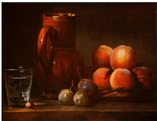
Jean-Baptiste Siméon CHARDIN