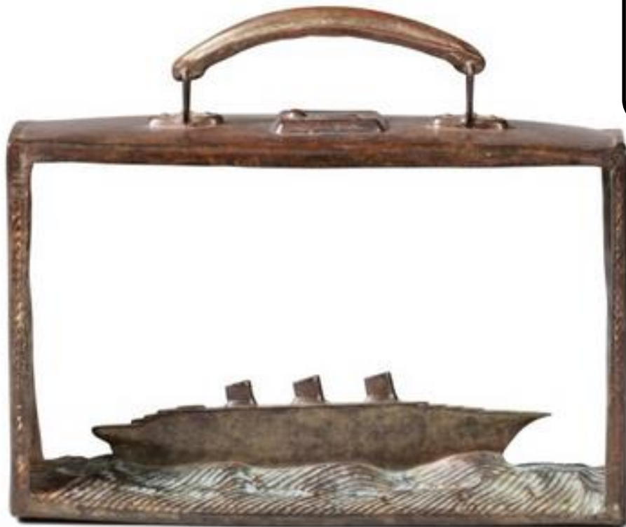
Jean-Michel Folon Partir (F232), 2001 Sculpture / Bronze 24 x 28 X 8 cm