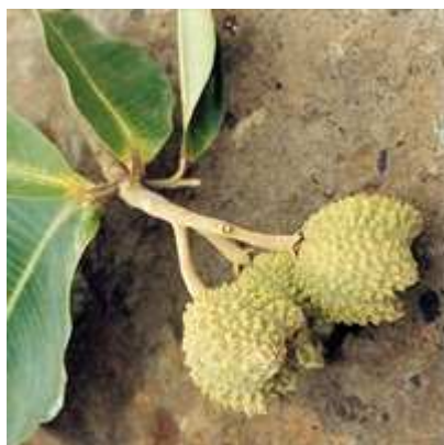
Yangu - fruits

Arbre Africain largement répandu sur la partie sud de ce continent où il peut atteindre plus de 20 mètres de haut à l'état sauvage.