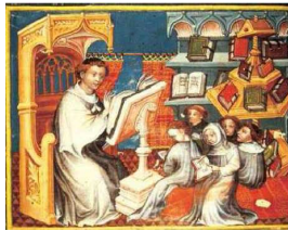
clerc qui enseigne