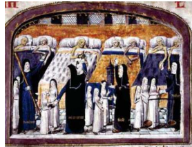
clerc qui soigne