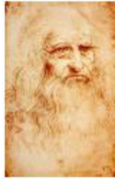
Leonard de Vinci

Il travailla pour de nombreux rois et reines dont François 1er en France.