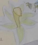
Nectar de Vanille