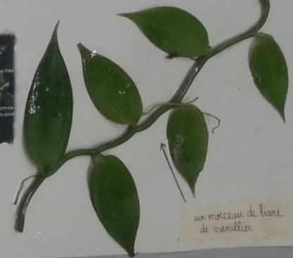
un morceau de bois de vanillier