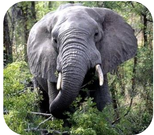
L'éléphant mange une touffe d'herbe.