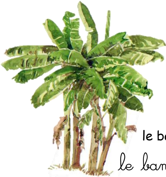
le bananier le bananier