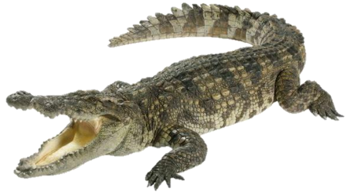
Un crocodile - un crocodile