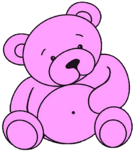
un ours rose