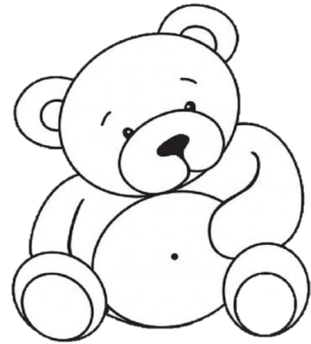
un ours blanc