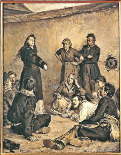
Louise Michel haranguant les communards, scène peinte par Jules Girardet, en 1883.