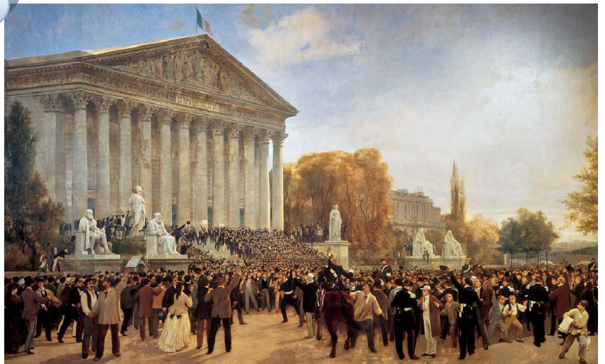
Proclamation de la République, 1870 (Jacques Guiaud)