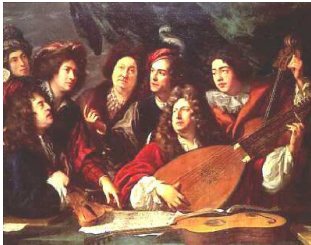
les artistes soutenus