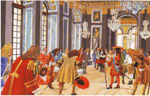
une journée du roi-soleil