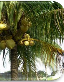
La noix de coco