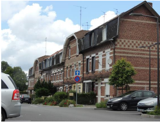
Habitations de la cité Khulmann à Odomez