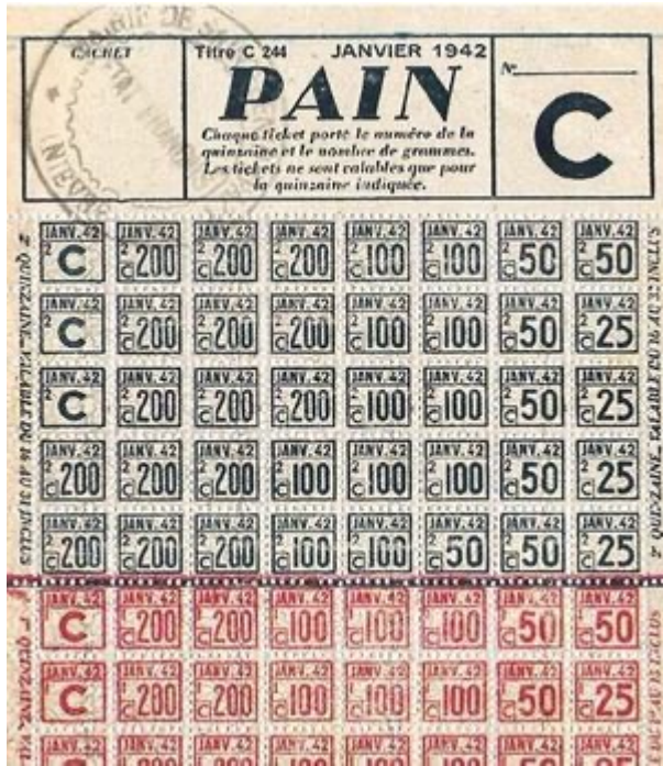
Ticket de rationnement à échanger contre du pain