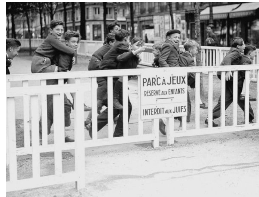
Dans Paris en 1942

Depuis 1940, la mention « Juif » est apposée sur les cartes d'identité, la première des mesures discriminatoires : achats limités au créneau 15-16 heures, interdiction des musées, bibliothèques, stades, jardins, etc.