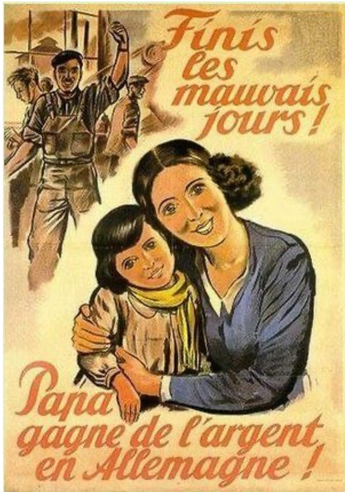
Affiche de propagande du régime de Vichy de 1943