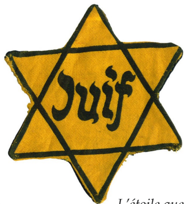
L'étoile que les juifs doivent porter sur tous leurs vêtements.