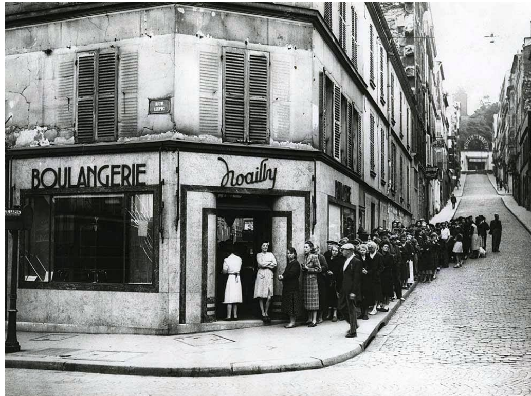
La queue devant la boulangerie Noailly en 1942