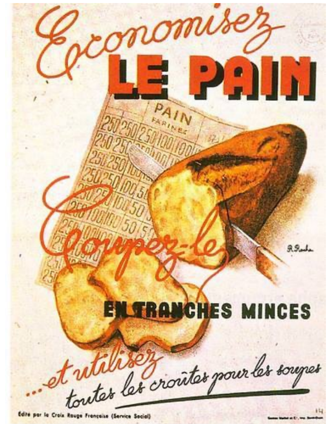
Affiche de la croix Rouge en 1942

Les Français manquent de tout. Les produits courants (lait, pain, café...) sont rationnés. Se nourrir, se chauffer, se vêtir deviennent les principales préoccupations de la population. Il faut faire de longues heures de queue pour se ravitailler et il n'y a pas toujours de denrées pour tout le monde.