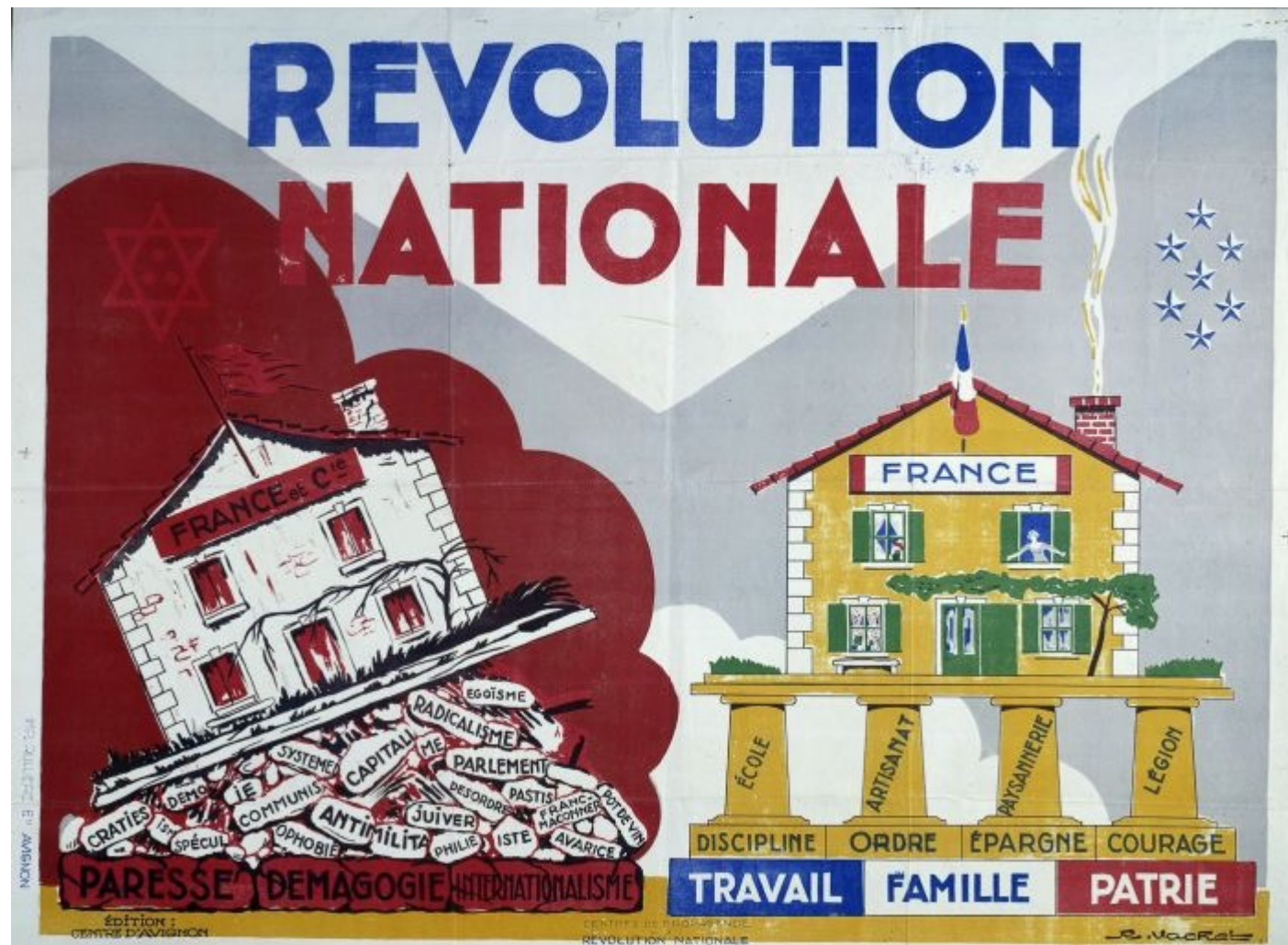
Affiche de R. Vachet, du Centre de Propagande de la Révolution Nationale