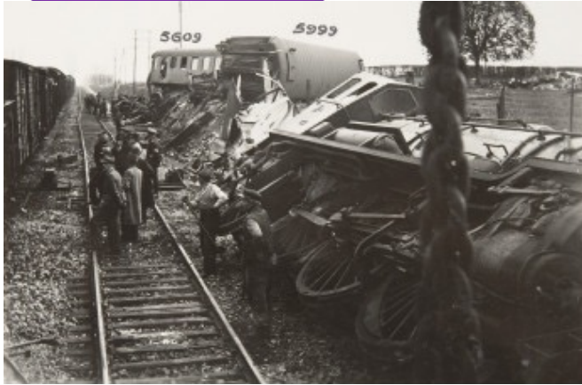
Photographie de l'attentat d'Airan dans la nuit du 15 au 16 avril 1942

Un jeune résistant s'entraîne à tirer au fusil dans les Alpes du Sud, en octobre 1944.