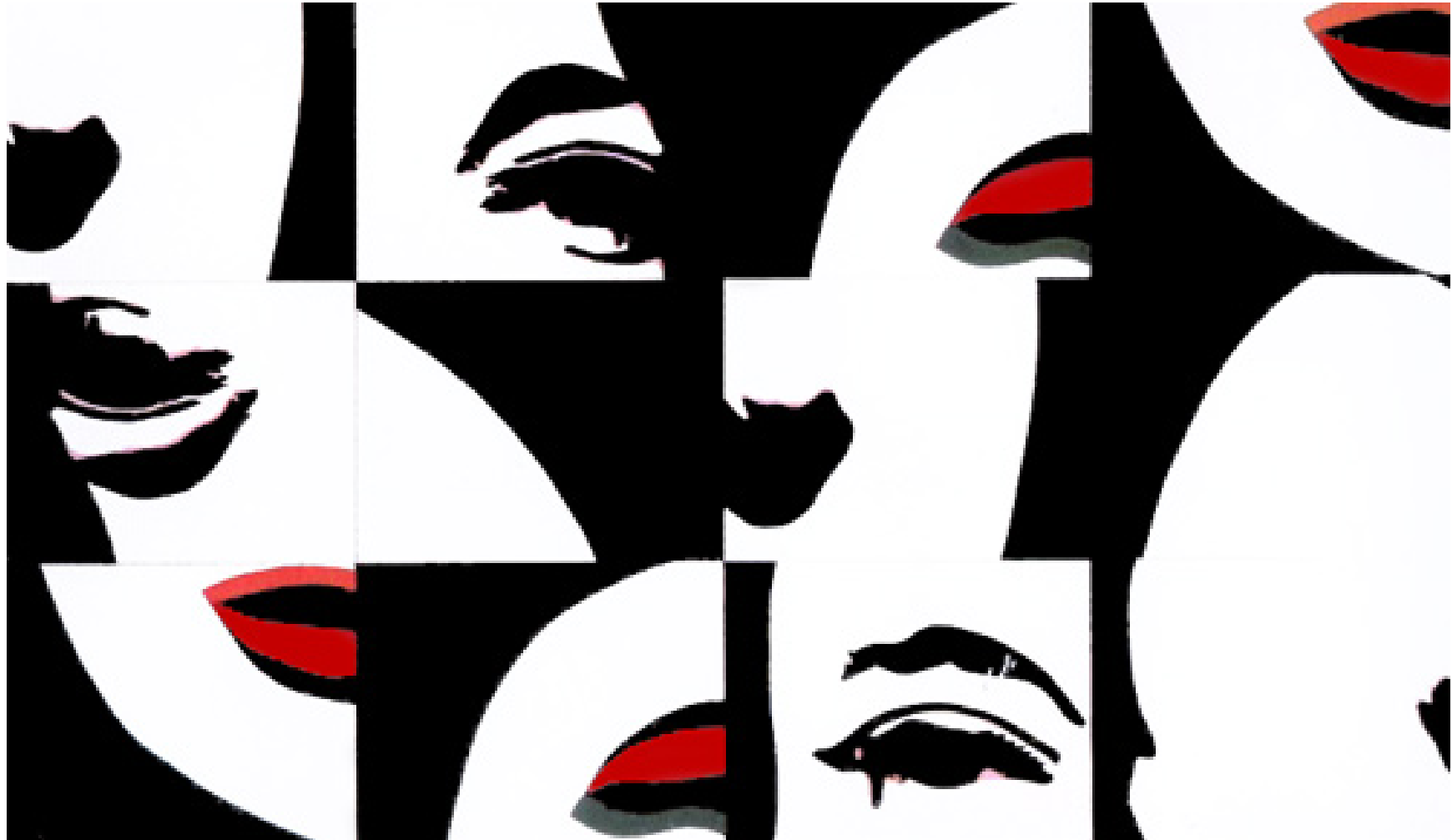
Life is so complex , Martial Raysse, 1966, plexiglas coloré opaque ou transparent découpé et moulé sur contreplaqué, 150,2 x 250 cm, Musée de Grenoble.