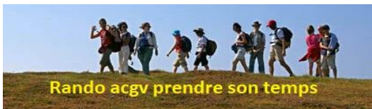
Rando acgv prendre son temps

http://randoacgv.eclablog.net/ Renseignement: « JP » 0676841261