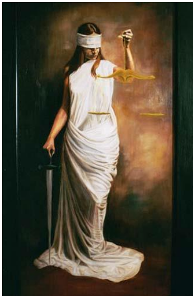
Lady Justice, Chad Awalt