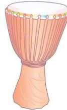
Afrique noire Le djembe

Son père est musicien Il joue du tambour africain Mustafa lui aussi voudrait jouer Du bougaroubou et du djembé.