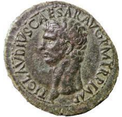
Monnaie de l'antiquité