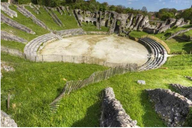
Site archéologique et mégalithiques de Gennes