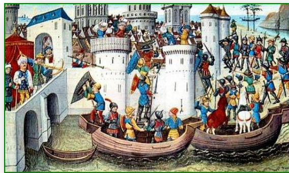
Prise de Constantinople par les croisés, 1204

Les musulmans ont pour ville sainte Jérusalem ce qui pose problème aux chrétiens pour lesquels cette ville est également une ville sainte. Dans le but de récupérer Jérusalem, les chrétiens d'Europe organisent la 1ère croisade de 1096 à 1099.