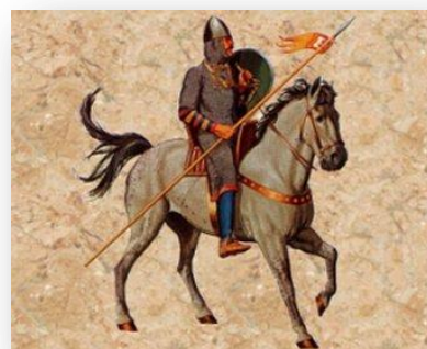
Chevalier du moyen-âge