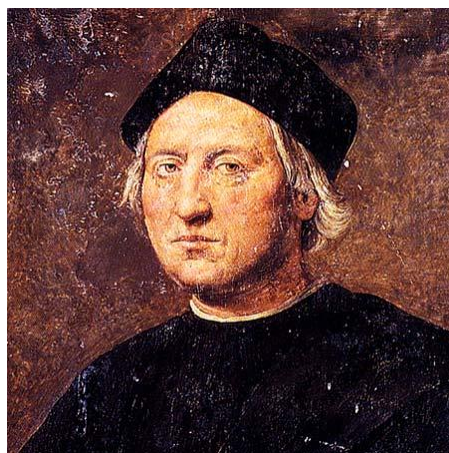
Portrait présumé de Christophe Colomb