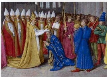
Sacre de Charlemagne en tant qu'empereur, 800

En 751, Pépin le Bref fonde la dynastie des Carolingiens. Son fils Charlemagne devient roi de France en 768. A sa mort, ses successeurs sont incapables de défendre leur territoire face à de nouveaux envahisseurs.