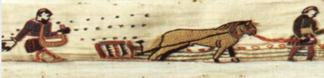
Doc 2 : Tapisserie de Bayeux, XIe siècle