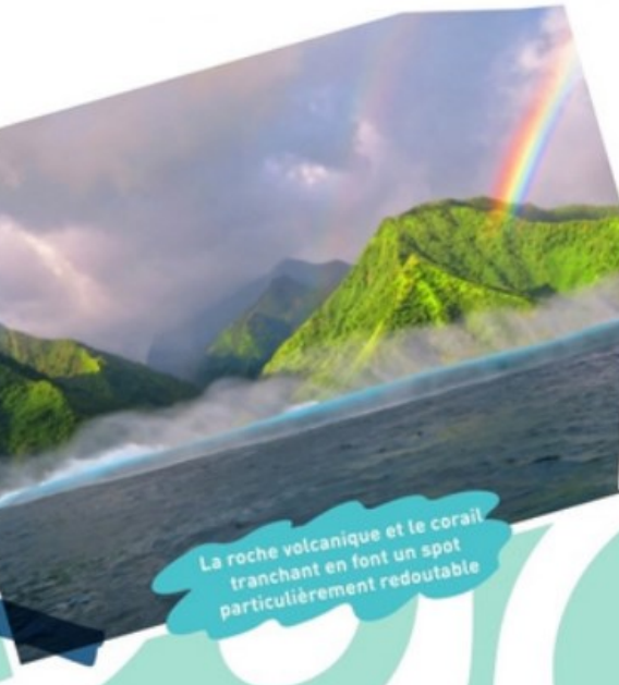
La roche volcanique et le corail tranchant en font un spot particulièrement redoutable

Theahupoo, que l'on prononce "tchiopo", si elle n'est pas n'est pas la plus haute vague de la planète, a la particularité assez unique d'être presque aussi large que haute. C'est une vague particulièrement puissante qui atteint régulièrement 5 mètres de haut (jusqu'à 10 parfois) et 4 mètres de diamètre, s'enroulant alors en forme de tube, véritable rouleau compresseur.