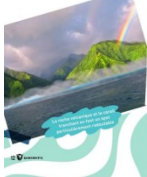
La roche volcanique et le corail forment un spot particulièrement spectaculaire.