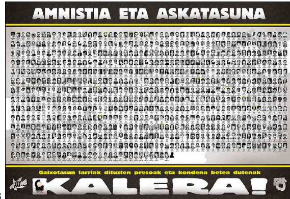
Cartel pidiendo la amnistía para los presos etarras

Hoy los presos etarras son unos 700 (~500 en España); se agrupan en el colectivo EPPK . Suelen acatar las órdenes de ETA: plantear la cárcel como un frente de lucha, no acogerse a los derechos que les corresponden (permiso de salida, libertad condicional, etc). Una gran mayoría de ellos apoya el Acuerdo de Gernika .