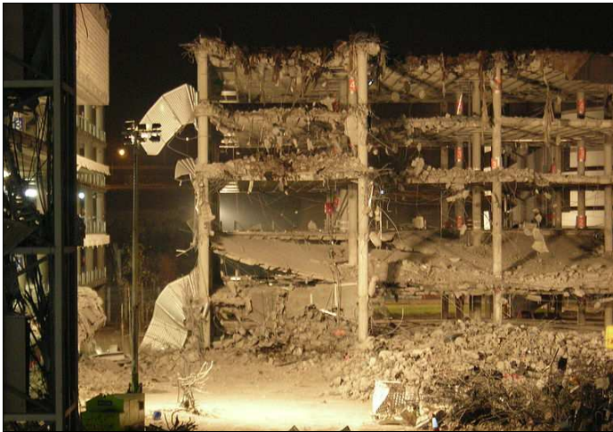
Atentado de Madrid-Barajas (2007)

En 2005, Zapatero aceptó negociar con ETA a cambio del fin de la violencia. En 2006, ETA anunció un alto el fuego . Las negociaciones fracasaron, y en diciembre de 2007 estalló una bomba en el aeropuerto de Madrid-Barajas (2 muertos). ZP fue duramente criticado por haber dialogado con ETA.