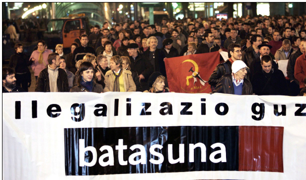
Manifestación contra la ilegalización de Batasuna

En el 2000, el PP y el PSOE firmaron un Pacto antiterrorista : se comprometían a colaborar para acabar con la legitimación política de la violencia. Desembocó en la Ley de Partidos (2002) : permitió prohibir los partidos que atentaran contra la democracia, justificaran el racismo o el terrorismo.