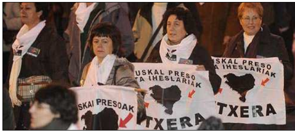
Manifestación por la repatriación de los presos etarras

Hoy los presos etarras son unos 700 (~500 en España); se agrupan en el colectivo EPPK . Suelen acatar las órdenes de ETA: plantear la cárcel como un frente de lucha, no acogerse a los derechos que les corresponden (permiso de salida, libertad condicional, etc). Una gran mayoría de ellos apoya el Acuerdo de Gernika .