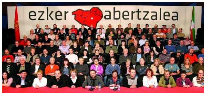
El conjunto de la izquierda abertzale

La izquierda abertzale ( radical, patriota ) reúne partidos políticos, sindicatos, asociaciones y medios de comunicación que quieren crear un Estado vasco. Algunas organizaciones que la componen serían satélites de ETA. Batasuna ya presentó candidatos que eran (ex) miembros de ETA, y ETA llamó a votar por ese partido en varias ocasiones. El 25 de septiembre de 2010, la izquierda abertzale firmó el Acuerdo de Gernika , en el que pedía a ETA el abandono de las armas, la derogación de la Ley de Partidos y de la Ley antiterrorista y el acercamiento de los presos etarras al País Vasco. Inició así un proceso de paz, buscando una vía exclusivamente política para la soberanía vasca.