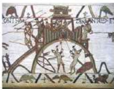
Tapiserie de Bayeux représentant la prise du château de Dinant

Dans ce texte, colorie « deux choses » que lancent les ennemis pour attaquer le château-fort.