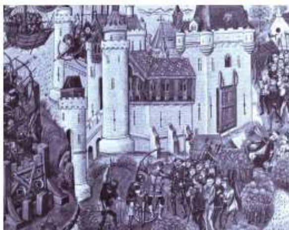
Miniature représentant la prise d'un château-fort

Sur ces deux documents, recherche toutes les façons d'attaquer le château-fort et note-les ici :